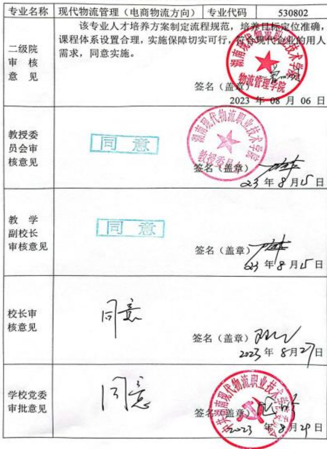
附表 7 专业人才培养方案审批表